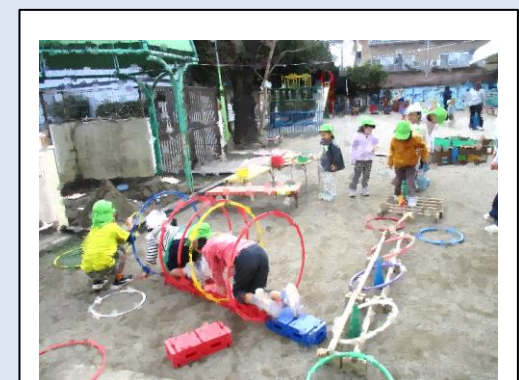
自分たちでコースを作り、楽しんでいる様子。

子供たちは自分たちで用具を組み合わせコースを作り、またぐ、這う、くぐる、バランスをとって渡る…などの多様な運動遊びを楽しむ姿が見られた。