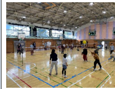
親子でソフトバレーボールのゲームをしている様子。

日本バレーボール協会と連携して、親子バレーボール教室「つなぐスクール」を小学校第3～6学年とその保護者を対象として実施した。