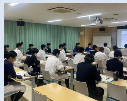
メンタルトレーニング研修会

2月17日（土）に希望者を募って、メンタルトレーニング研修会を実施しました。前回の講演会をうけて、実際にメンタルトレーニングを実践したい生徒約40名に対して石川真由美氏のメンタルトレーニング研修会を実施しました。生徒の意欲も高く、ポジティブに行動するための行動を繰り返してトレーニングしました。今後も継続的に実施をしていく予定です。