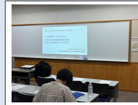
夏季研究協議会の様子